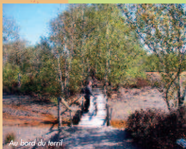
Au bord du terril

C'est d'abord de larges voies et des chemins agricoles qui nous invitent à pousser la cadence au cœur de la campagne. Puis de petits villages en hameau isolé le circuit