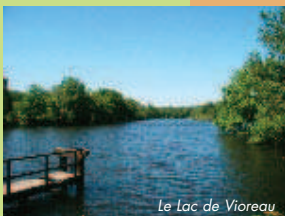
Le Lac de Vioreau

Musée Agri-Rétro (à 8 km dir. Abbaretz). Collection unique de 200 machines agricoles : tracteur, moissonneuse-batteuse, machine à vapeur. Ouvert du 15 avril au 15 octobre. Tél : 02 40 55 19 71